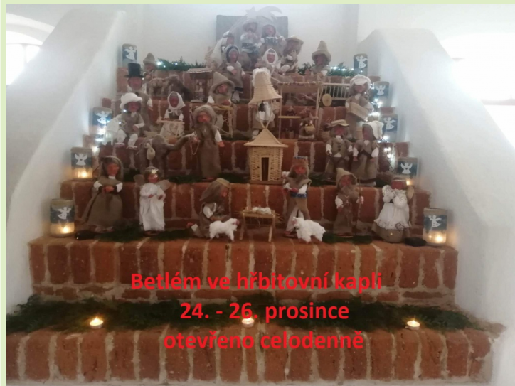
Betlém ve hřbitovní kapli 24. - 26. prosince otevřeno celodenně