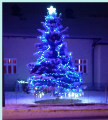
ROZSVÍCENÍ VÁNOČNÍHO STROMU A MIKULÁŠ