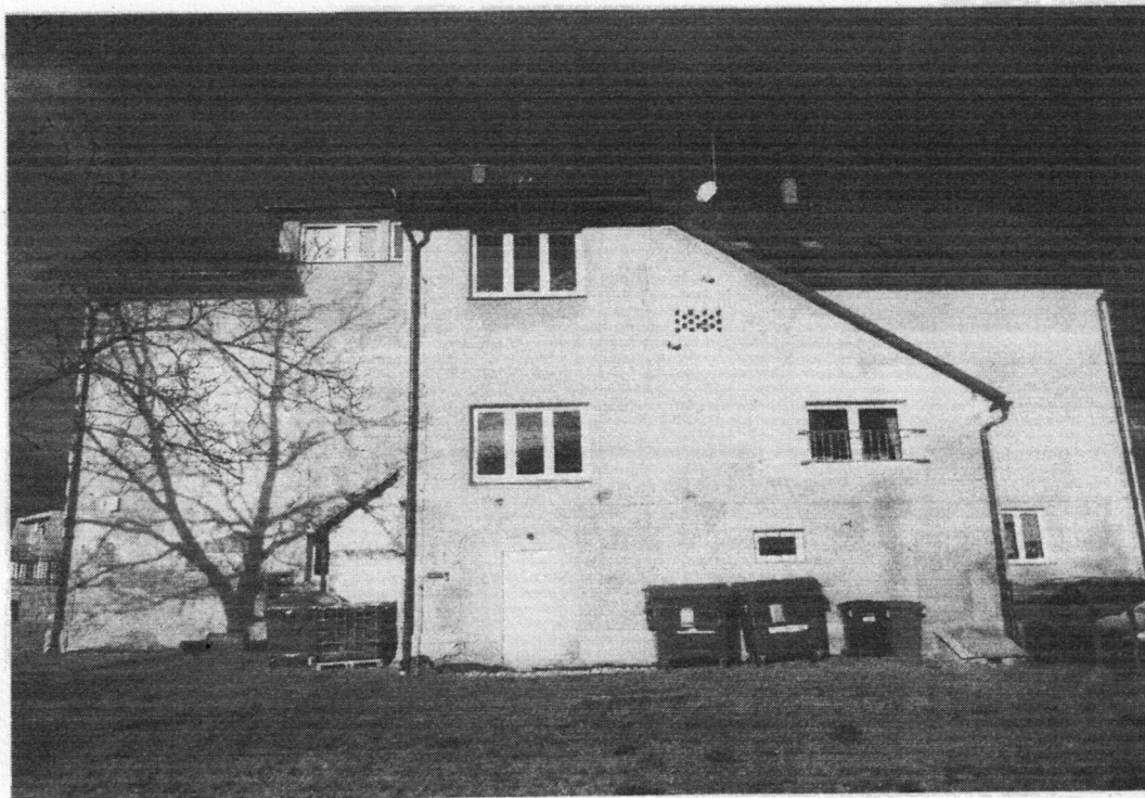
obr: jihovýchodní fasáda

Dále bylo zjištěno, že v rámci nových venkovních omítek nebude provedena výměna oken a dalších výplní otvorů, protože toto bylo již provedeno dle sdělení paní starostky před cca 2 lety.